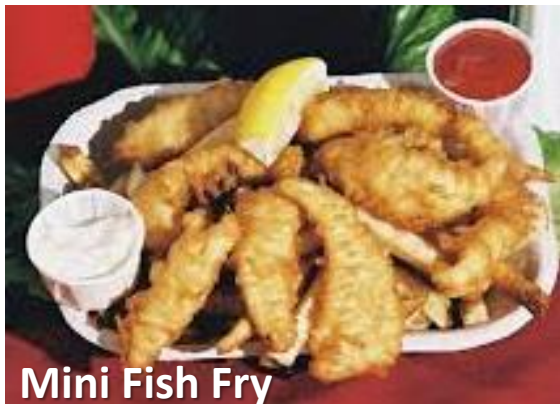
Mini Fish Fry