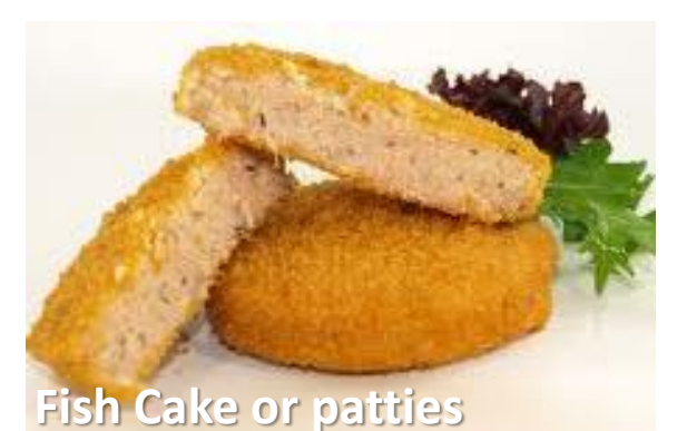
Fish Cake or patties